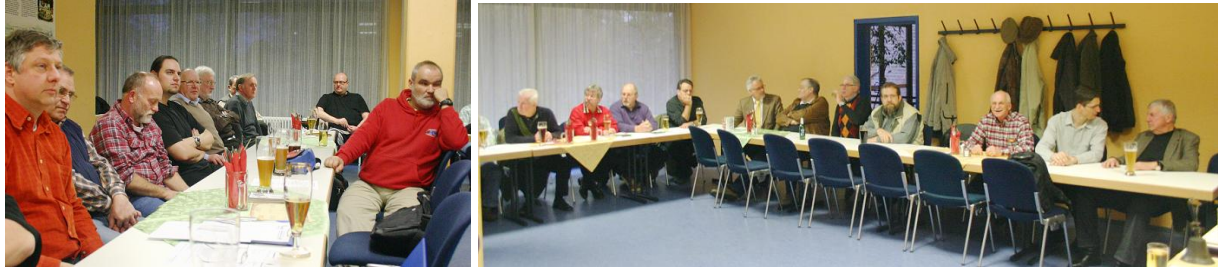
Blick in die Runde – Heitere Stimmung, denn gleich gibt es das Essen