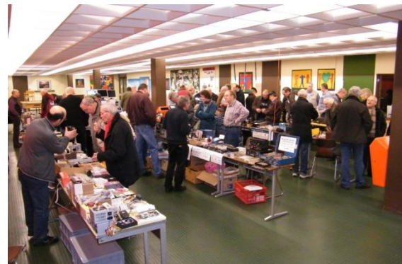
ACE Börse: Viel Betrieb im letzten Jahr

und bei mir zwischenlagern. Für den Flohmarkt in Oppenheim werde ich zwei Tische bestellen, die Helfer beim Flohmarkt habe ich schon zusammen. Termin der 25. Oppenheimer Funkbörse (Flohmarkt) ist Samstag, der 12. März 2011, 9.00 – 14.00 Uhr am bekannten Standort.