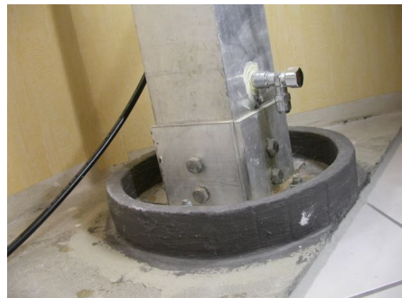
Die Mastfassung mit „Zapfstelle“